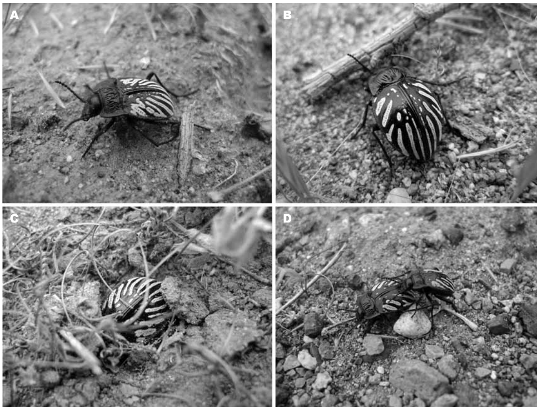
Fig. 3. Gyriosomus luczotii : A. Hábito del adulto macho; B. Hábito del adulto hembra; C. Conducta evasiva del adulto; D. Pareja de adultos en cópula.

Fig. 3. Gyriosomus luczotii : A. Habitus of male adult; B. Habitus of female adult; C. Evasive behavior of an adult; D. Adult couple mating.