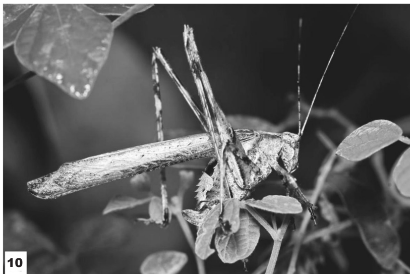
Fig. 10. Insara bolivari (hembra) en estado natural.

Figs. 7–9. Sictuna zebrina (Piza, 1980) n. comb.: 7. Habitus in dorsal view; 8. Rostrum; 9. Head and pronotum in latero–dorsal view.