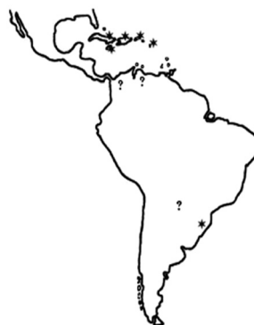
Fig. 4. Geographic distribution of H. caraibus Sharp: * Confirmed records; ? Not confirmed records.