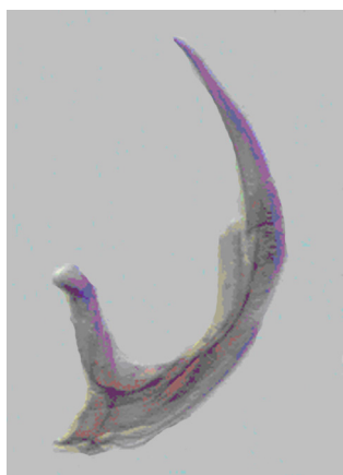
Fig. 2. Edeago de H. caraibus Sharp (100x).