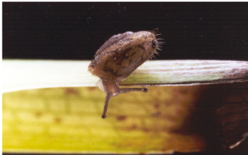
Fig. 4. Montserratina martorelli (Bourguignat, 1870), 2,5 x 5 mm. Localitat de recol·lecció 35.