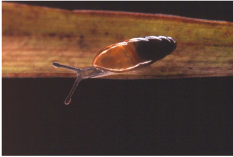
Fig. 2. Hypnophila boissii (Dupuy, 1850), 6 x 2 mm. Localitat de recol·lecció 35.