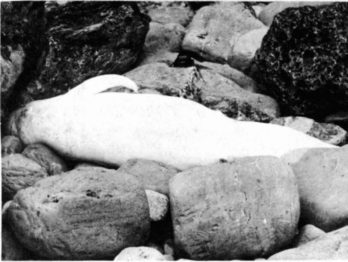
Fig. 1. Vista dorsal del ejemplar, en la que se observa la aleta falciforme típica del género.