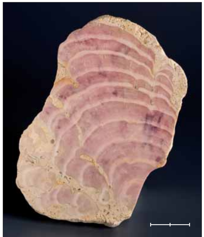
Fig. 16. Secció polida de Solenopora jurassica Brown, 1894, rodofícia del Juràssic mitjà de Gloucester (Gloucestershire, Anglaterra, Regne Unit). Són evidents les diferents fases de creixement i les restes de la coloració original. Exemplar MGB 42526 figurat a Gómez-Alba (1988, làm. 1, fig. 1). Escala, 2 cm.

Fig. 15. Tooth (MGB 42360) of Desmostylus hesperus Marsh, 1888, a sea mammal living during the Miocene in California (United States of America). Scale bar, 1 cm.