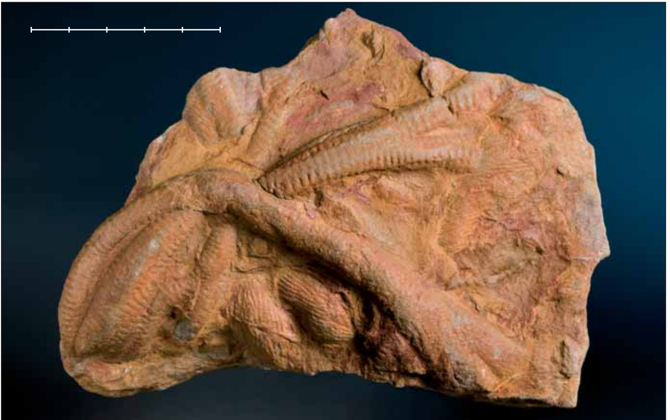
Fig. 21. Bilobites sp. (MGB 42397 probablement Cruziana ), icnofòssil de l'Ordovicià de Las Navas (Baterno, Badajoz). Aquest jaciment fou descobert pel Dr. Gómez-Alba en el decurs dels seus estudis com a geòleg a la Universidad Complutense de Madrid. Escala, 5 cm.

Fig. 20. Leaf of Persea princeps (Heer, 1856) Schimper, 1870 from the Pontian (Miocene) of Prats (Prats i Sansor, Girona province, NE Spain). Specimen MGB 42782 figured in Barrón (1995, pl. 9, fig. 1). Scale bar, 4 cm.