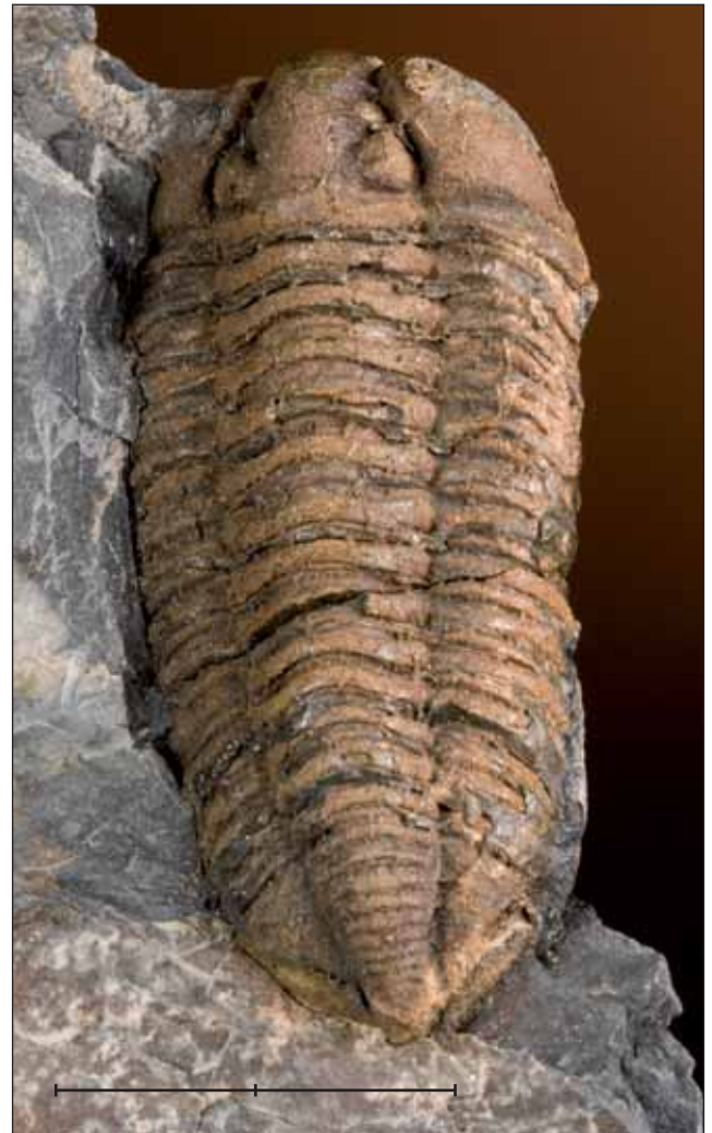
Fig. 9. Colpocoryphe grandis (Snajdr, 1956), trilobit del Llandeilo (Ordovicià) de Las Ventas con Peña Aguilera (Toledo). Exemplar MGB 42177 figurat a Gómez-Alba (1988, là. 274, fig. 9). Escala, 2 cm.

Vitré, Ille-et-Vilaine, França Silurià, Wenlock MGB 42850 (Gómez-Alba, 1988, Là. 272, Fig. 7) latifrons (Bronn, 1825), Phacops Gerolstein, Vulkaneifel, Rheinland-Pfalz, Alemanya Devoniana mitjà, Eifeliana MGB 42181 macrophthalmia (Brongniart, 1822), Eodalmanitina Las Ventas con Peña Aguilera, Los Montes de Toledo, Toledo, Espanya Ordovicià, Llandeilo basal MGB 42176 megalops (McCoy, 1846), Otarion Dudley, West Midlands, Anglaterra, Regne Unit Silurià, Wenlock, MGB 42851 (Gómez-Alba, 1988, Là. 272, Fig. 8) mirus Beyrich, 1845, Sphaerexochus Bohemia, Bohemia, República Txeca Silurià, Llandoveryà superior-Wenlock