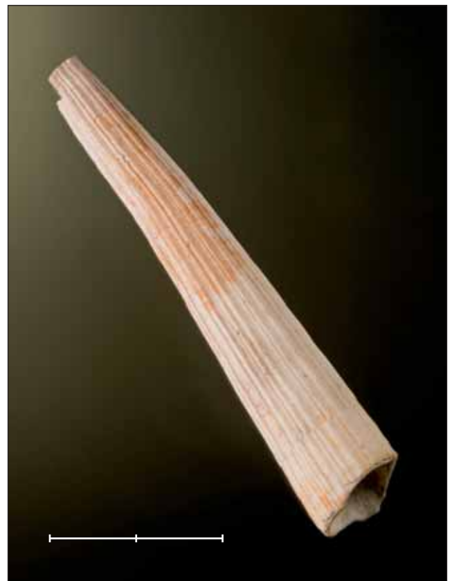
Fig. 3. Dentalium (Fissidentalium) rectum Gmelin, 1791, escafòpode del Pliocè de Perpinyà (Pirineus-Oriental, França) (MGB 40244). Escala, 2 cm.

Bonares, El Condado, Huelva, Espanya Neogen, Pliocè