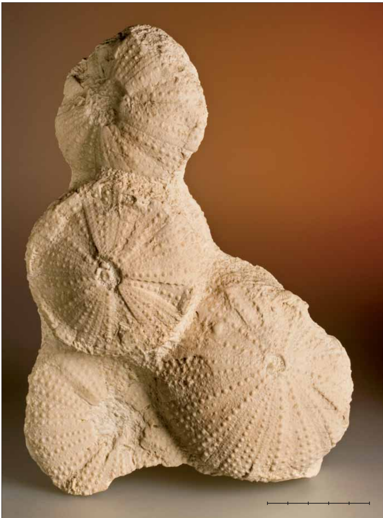
Fig. 12. Grup MGB 42248 de Tripneustes parkinsoni Agassiz, 1847 del Burdigalià (Miocè) de Lacoste (Vaucluse, França). Escala, 5 cm.