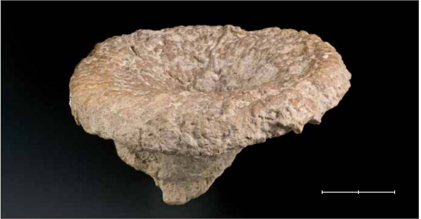
Fig. 1. Tremadictyon reticulatum (Goldfuss, 1826), esponja procedent del Juràssic superior de Frías de Albarracín (Terol). Exemplar MGB 39805 figurat a Gómez-Alba (1988, lám. 23, fig. 2). Escala, 2 cm.