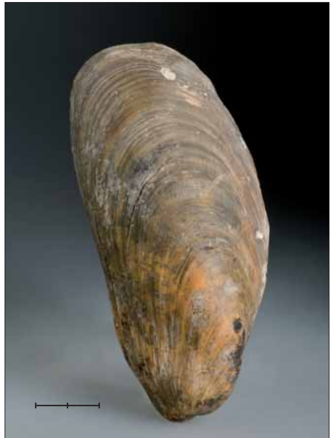
Fig. 5. Modiolus modiolus (Linnaeus, 1758), bivalve del Pliocè-Holocè, dragat del fons marí davant Sant Carles de la Ràpita (Montsià, Tarragona). Exempler MGB 40374 figurat a Gómez-Alba (1988, làm. 85, fig. 7). Escala, 2 cm. Fig. 5. Modiolus modiolus (Linnaeus, 1758), a bivalve from the Pliocene-Holocene, dredged from the sea bottom off Sant Carles de la Ràpita (Tarragona province, NE Spain). Specimen MGB 40374 figured in Gómez-Alba (1988, pl. 85, fig. 7). Scale bar, 2 cm.