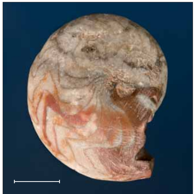
Fig. 8. Manticoceras aff. intumescens (Beyrich, 1837) del Frasnà superior (Devonià superior) de El Tafilelt (Errachidia, Marroc). Exemplant MGB 41881. Escala, 1 cm.

Fig. 8. Manticoceras aff. intumescens (Beyrich, 1837) from the Upper Frasnian (Upper Devonian) of El Tafilelt (Errachidia, Morocco). Specimen MGB 41881. Scale bar, 1 cm.