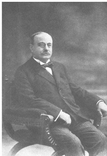
Fig. 2. Artur Bofill i Poch, impulsor de l'escola catalana de malacologia.

Fig. 2. Artur Bofill i Poch, promotor of the Catalan school of malacology.