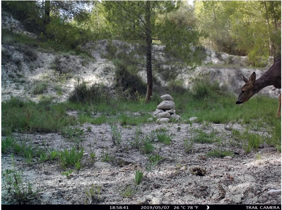
Fig. 2. Imagen de un ejemplar hembra de corzo ( C. capreolus ) tomada en el norte de la provincia de Alicante.