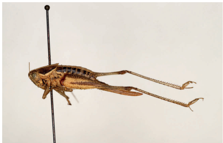
Fig. 20. Ctenodecticus pupulus Bolívar, 1877, sintipo ♀, L = 19,5 (MZB 74-4910).