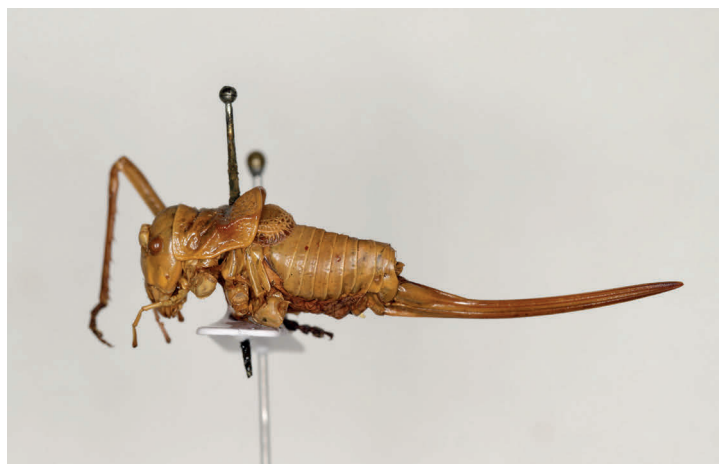
Fig. 9. Ephippiger brunnerii Bolívar, 1877, sintipo ♀, L = 37 (MZB 74-5174).

Sintipo: MZB 74-5174, 1♀ (fig. 9). Etiquetado como: [♀] [Aranjuez] (manuscrita por el autor); [EX COL. / MARTORELL / I PEÑA] [Ephippigero Brunnerii / Aranjuez / r] Bolivar] (manuscrita por el autor); [74-5174 MZB / Steropleurus brunnerii / (Bolívar, 1877)] [SINTYPUS].