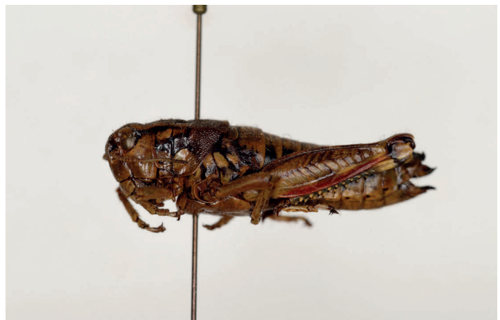
Fig. 30. Podisma ignatii cantabricae Morales Agacino, 1950, paratipo ♀, L = 24,5 (MZB 68-0819).

MZB 68-0819, 1♀ (fig. 30). Etiquetado como: [Valle del Lago 1.565 m / Somiedo (Oviedo)] [Exp. Inst. Esp. / Entomología] (anverso) [29-VII-50] (reverso); [ Podisma ignatii / cantabricae Mor / Det. E. Morales 1950] [Paratipo] [68-0819 / MZB].