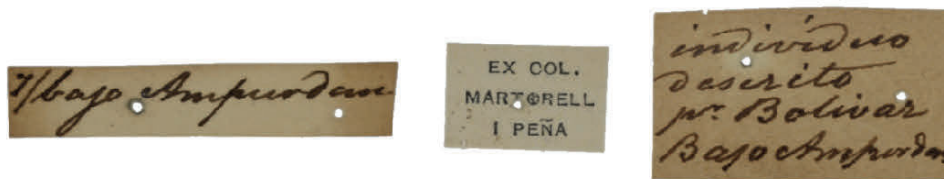
Etiquetas originales del sintipo MZB 74-5125.