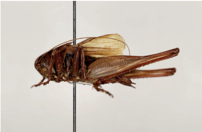
Fig. 22. Metrioptera maritima Olmo-Vidal, 1992, holotipo ♂, L = 18 (MZB 68-0831).