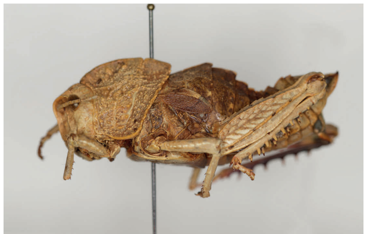
Fig. 24. Eunapius laetus mazaganicus Bolívar, 1907, sintipo ♀, L = 42 (MZB 68-0828).

Comentarios: Bolívar (1907) no fija holotipo. Comenta la gran variabilidad morfológica encontrada entre distintos ejemplares. La Greca (1993), en su estudio de revisión del género, apunta 1♂ y 1♀ sintipos depositados en el MNCN; posteriormente, Massa (2012) estudia «2♂♂ y 5♀♀ paratypi», sin indicar depositarios. En el MNCN se conservan un total de 11♂♂ y 34♀♀ sintipos (M. París, com. pers., 27/09/2022).