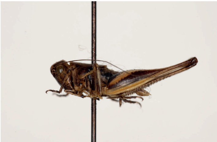
Fig. 21. Ctenodecticus thymi Olmo-Vidal, 1999, holotipo ♂, L = 9 (MZB 99-1114).