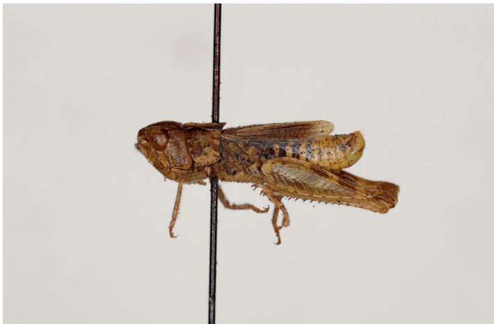
Fig. 28. Gomphocerus (Omocestus) minutissimus Bolívar, 1878, paralectotipo ♂, L = 11,5 (MZB 68-0824).