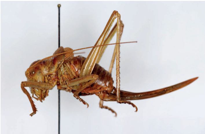
Fig. 14. Ehippigerida asella Navás, 1907, holotipo ♀, L = 38 (MZB 73-3220).