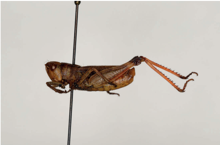
Fig. 27. Chorthippus saulcyi uvarovi Morales Agacino, 1943, paratipo ♂, L = 15 (MZB 68-0826).