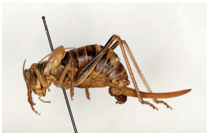
Fig. 12. Ephippiger stalii Bolívar, 1877 sintype ♀, L = 39 (MZB 74-5102).