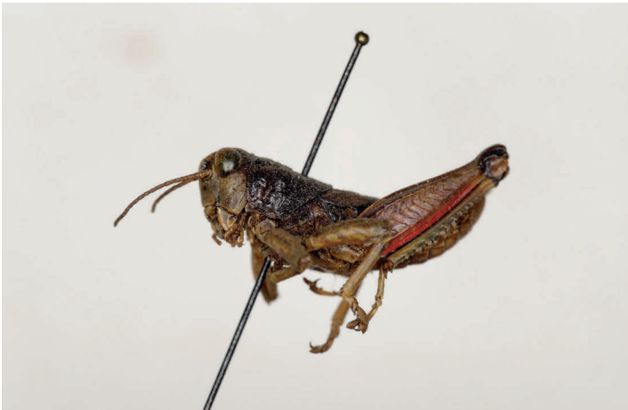
Fig. 29. Podisma ignatii Morales Agacino, 1950, paratipo ♂, L = 16 (MZB 68-0817).