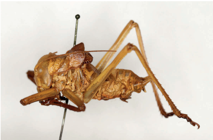
Fig. 13. Platystolus martinezii (Bolívar, 1873), sintipo ♂, L = 28 (MZB 74-5090).