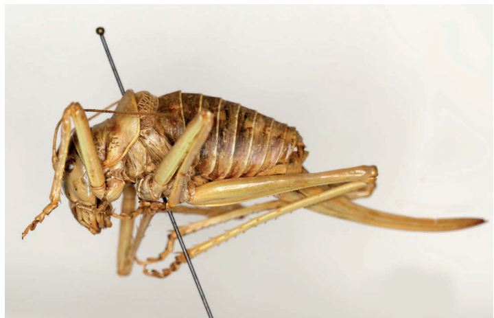
Fig. 11. Ephippiger pantingana Navás, 1904, sintipo ♀, L = 24 (MZB 68-0829).

Comentarios: Navás (1904) describe el macho y la hembra de la especie, sin fijar holotipo, ni precisar el número de ejemplares.