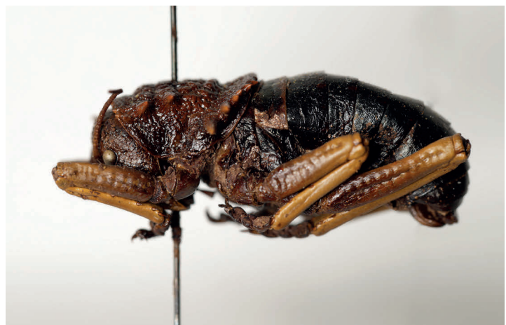
Fig. 17. Eugaster fernandesi Bolívar, 1936, sintipo ♂, L = 32 (MZB 68-0832).

Comentarios: subespecie descrita a partir de un solo ejemplar.