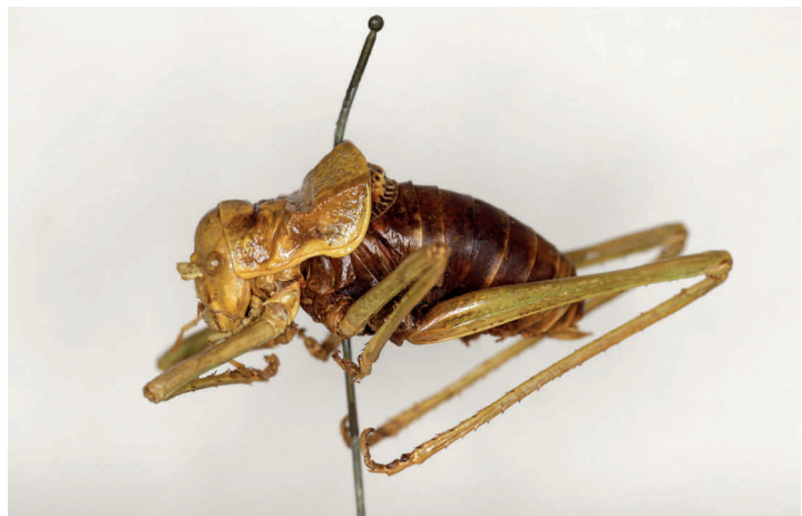
Fig. 10. Ehippiger (Steropleurus) martorellii Bolívar, 1878, sintipo ♂, L = 29 (MZB 74-5125).

MZB 74-5128, 1♂. Etiquetado como: [♂] [r] Ampurdan] (manuscrita por Martorell); [EX COL. / MARTORELL / I PEÑA] [74-5128 MZB / Parasteropleurus martorellii / (Bolívar, 1878)] [SINTIPO] (anverso) [♂8] (reverso).