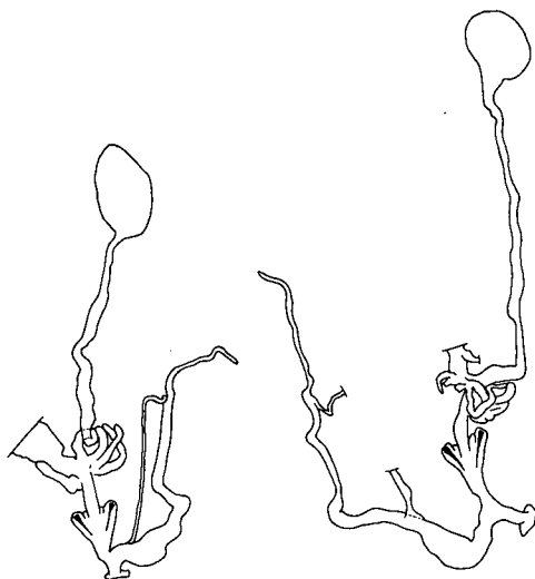
Fig. 2. Helicopsis (Helicopsis) gibilmanica (Bourguignat in SERVAIN, 1880), genitalia realizada por E. Gittenberger, 1973, ejs. de Palma del Condado.

Palma del Condado (12-III-73); Isla Cristina (13-III-73); Niebla, Dolmen La Lobita (24-III-73); Villalba del Alcor (2-XII-73); Gibrleón (5-III-75); Niebla (6-III-75); San Juan del Puerto (2-XII-73); Trigueros (16-III-82).