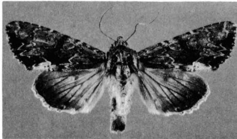
Fig. 1. Exempler adult de Apamea monoglypha Hfn. Adult specimen of Apamea monoglypha Hfn..

Eurasiàtica, és sens dubte l'espècie més freqüent del gènere a Catalunya. Fou descoberta per SAGARRA (1915), que l'assenyalà de la Vall d'Aran, Sant Julià de Vilatorça i Manlleu. Es tracta d'un element ampliament estès pel Pirineu, Pre-pirineu i Guïlleries-Montseny (WEISS, 1915; ROSSET, 1920; DE-GREGORIO, 1979a; DE PRINS, 1984; etc.), però que viu també a les serres pre-litorals i litorals: serra de Collcerola i ports de Tortosa (col. MZB), Anoia (Requena leg.). Inclosa als catàlegs dels Pirineus centrals (RONDOU, 1933) i Orientals (DUFAY, 1961). Citada d'Andorra (LAEVER, 1958). A la Península Ibèrica ocupa fonamentalment la meitat septentrional. Vola en una generació: VII-IX. Amb la forma típica hom recull de tant en tant la forma infuscata Busch-White.