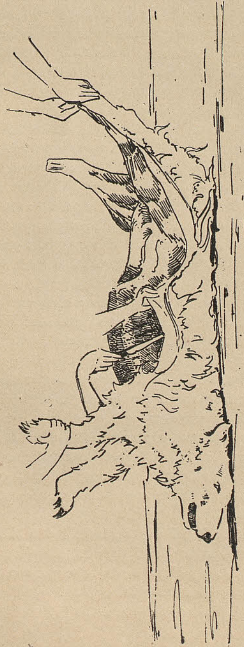
Fig. 1. — Manera de despellar un mamífer gros