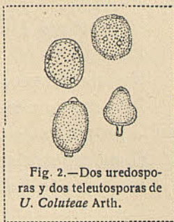
Fig. 2.—Dos uredosporas y dos teleutosporas de U. Coluteae Arth.

Esta especie es crítica, pues según P. MAGNUS ( in Ber. deutsch. bot. Ges. , 1891, p. 87, et in ib. , 1893, p. 43), los parafisos descritos bajo la fe de BURRILL ( in Bull. Illin. St. Lab. of Nat. Hist. , 1885, p. 165), son tan sólo pedúnculos persistentes de las uredosporas y teleutosporas. TRANZSCHEL ( in Die auf d. Gatt. Euph. etc., Ann. Myc. , VIII, 1910, p. 6), la considera como sinónima de U. proeminens (DC.) Lév., opinión compartida por SYDOW (P. et H.) en su Mon. Uredin. , V, II, 1910, p. 159.